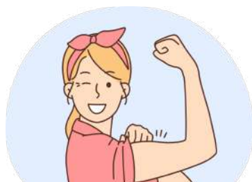
リハビリテーション プログラム