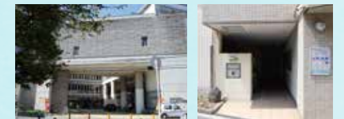
総合就労支援福祉施設 にしなりWing ヒューマン援護福祉プラザ (就労継続支援B型)

ひとりひとりの個性に応じた就労支援を行います。あなたのペースで、あなたらしい働き方を探してみませんか？