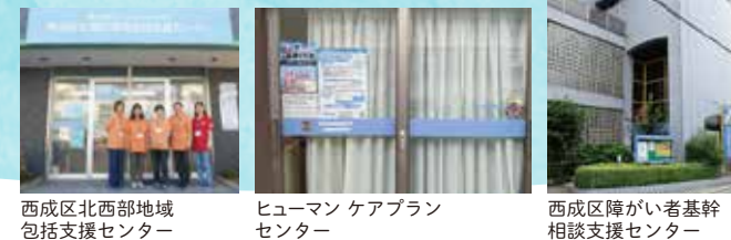
西成区北西部地域包括支援センター ヒューマンケアプランセンター 西成区障がい者基幹相談支援センター

「こんなことがあるけれど、どうしたらいいのかな。」困ったとき、悩んだとき、気軽に相談できる場所があります。