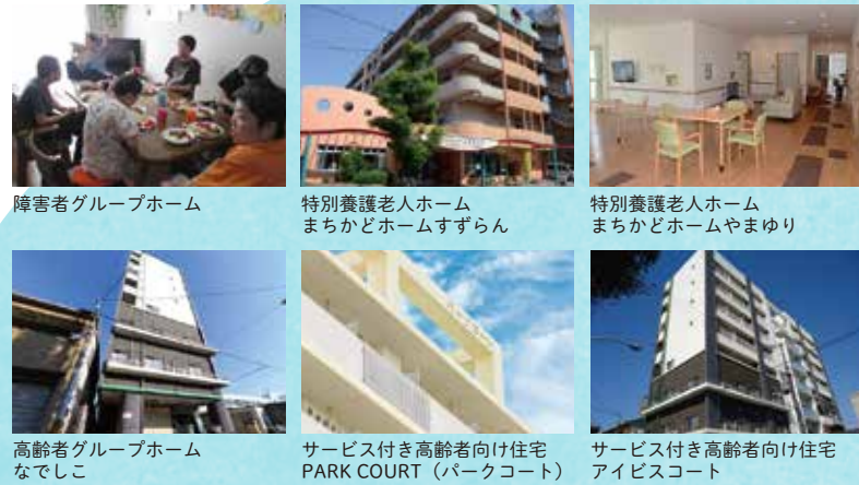
障害者グループホーム 特別養護老人ホーム まちかどホームすずらん 特別養護老人ホーム まちかどホームやまゆり 高齢者グループホーム なでしこ サービス付き高齢者向け住宅 PARK COURT (パークコート) サービス付き高齢者向け住宅 アイビスコート

「自分らしく、いきいきと住みたい。」私たちは、その思いに寄り添い、さまざまな住まいの形をサポートしています。あなたにあった住み方を、一緒に見つけましょう。