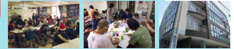
西成障害者会館 (送迎・入浴・リハビリテーション) 地域生活支援センター サワサワ ヒューマンインクルーシブセンタークリエバ

通うことで、元気でいきいきとした生活を！食事や入浴サービス、レクリエーションや創作活動など、利用者の方に合わせた活動を行います。