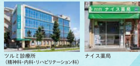
ツルミ診療所 (精神科・内科・リハビリテーション科) ナイス薬局

日々のお薬の処方から突然体調が悪くなったときまで、当法人が運営する病院が対応。あなたの健康を守り続けます。