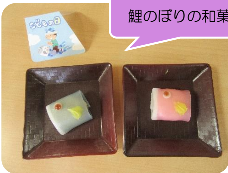
鯉のぼりの和菓子♪

色とりどりの紫陽花が可憐に咲く季節になりましたね。 先月は、こどもの日にちなんだ和菓子や山形県の郷土料理、母の日には抹茶ムースなど たくさんの行事食があり、皆様喜ばれていました😊