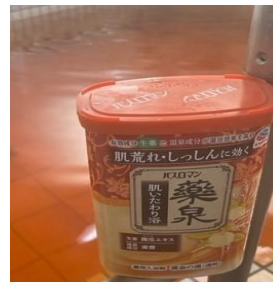
肌荒れ・湿疹に効く「薬泉」