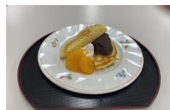
人気のこしあんを使ったホットケーキ

2月21日(月)～26日(土)の間で、 2月に お生まれになった方のお誕生日会を実施します。 特別なおやつとバースデーの色紙で 誕生日をお祝いしています。