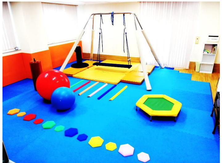
リハビリテーションルーム